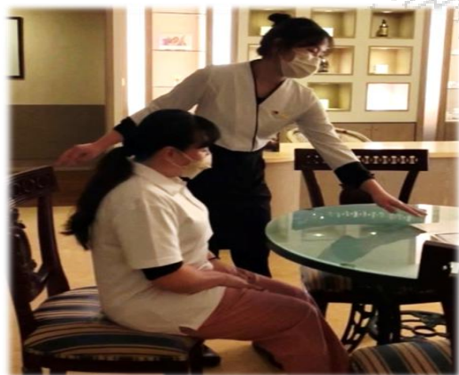
【美容保健科】顧客接待，療程介紹