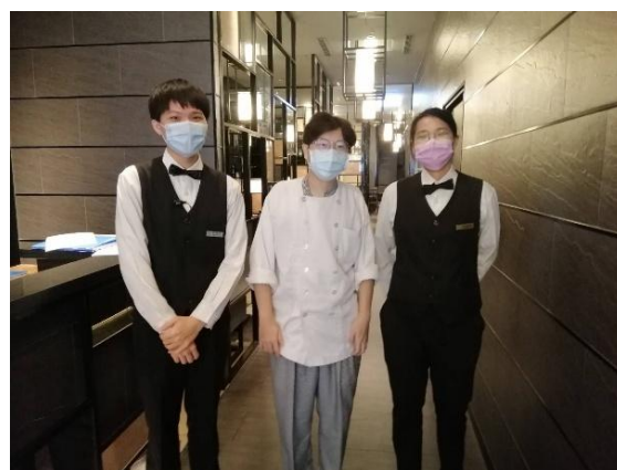
【餐飲管理科】實習生訪視