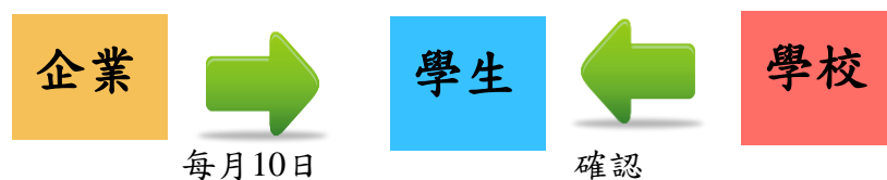
圖一 美保科針對企業給付各科學生生活獎學金或實習津貼機制 機構於每月10日將助學金直接匯給學生，再由科上教師向學生確認。