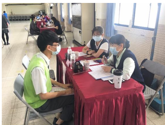
【老人服務事業管理科】展翅計畫媒合