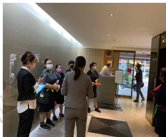
【應用外語科】機構消防演練