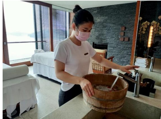
【美容保健科】療程前準備

經過這半年的實習，真的經歷了很多事情，從剛開始學習早班的工作，就花了很多時間在背整個流程，因常常忘東忘西所以練習讓自己有筆記的習慣，許多事就不容易忘記。中途因為車禍手有挫傷讓我沒辦法很好的使力，常常被學姊說我沒有