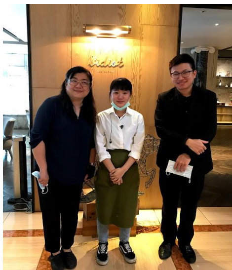
【應用外語科】華泰王子大飯店實習生訪視