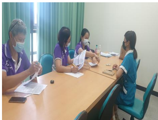
【護理科】展翅計畫醫院面試