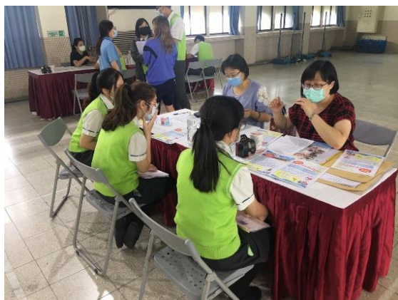
【老人服務事業管理科】展翅計畫媒合