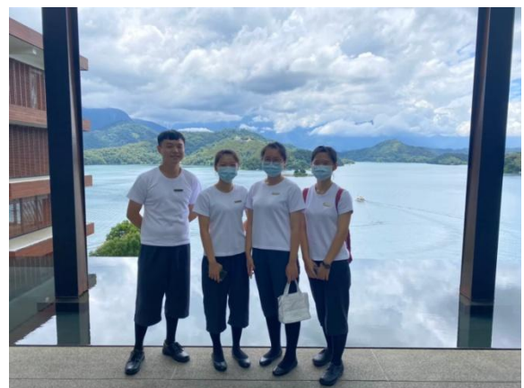
【美容保健科】新生訓練的合照

日治初期，日人為開發日月潭水力用以發電，興建了一間以竹葉與茅草覆頂的日式木造房屋，作為招所，是為涵碧樓前身。明治34年（西元1901年），日人伊藤於潭邊以檢木建造了一間豪宅，取名「涵碧樓」此後這裡便成為達官顯要與富商們在日月潭的度假場所。本學期參加展翅計畫的學生共有2位。