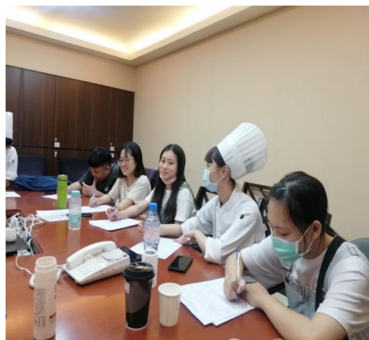
【餐飲管理科】實習生訪視