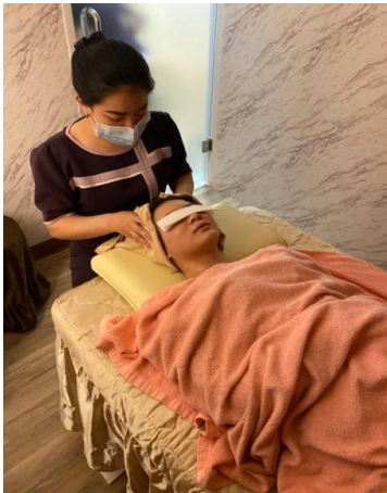
【美容保健科】 學生為客人進行頭部按摩