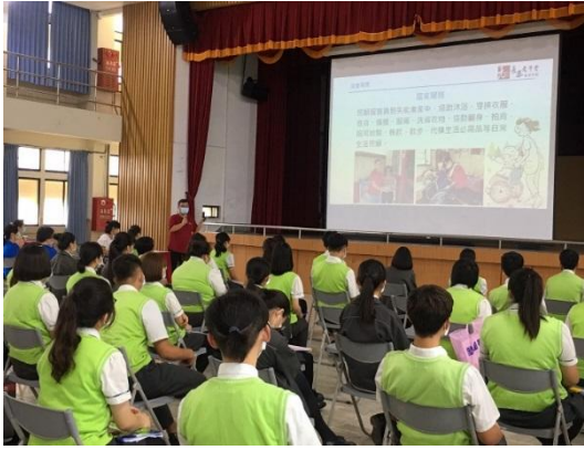
【老人服務事業管理科】 各家機構介紹