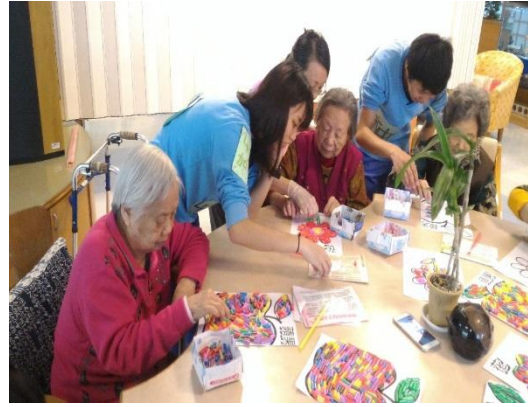
【老人服務事業管理科】 學生實習概況