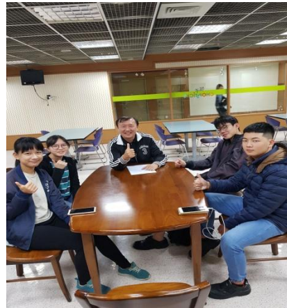
【餐飲管理科】 高雄義大實習生訪視