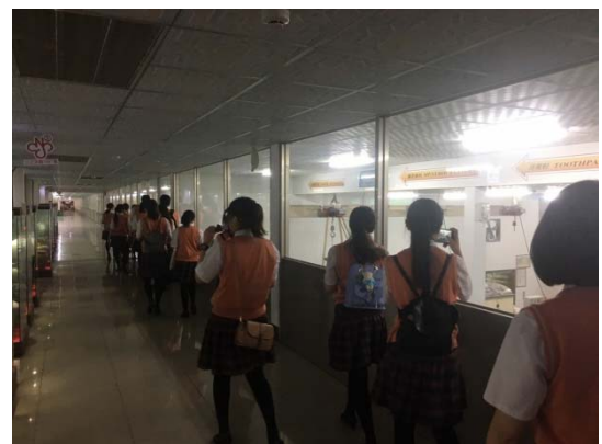
白人牙膏觀光工廠製程管理