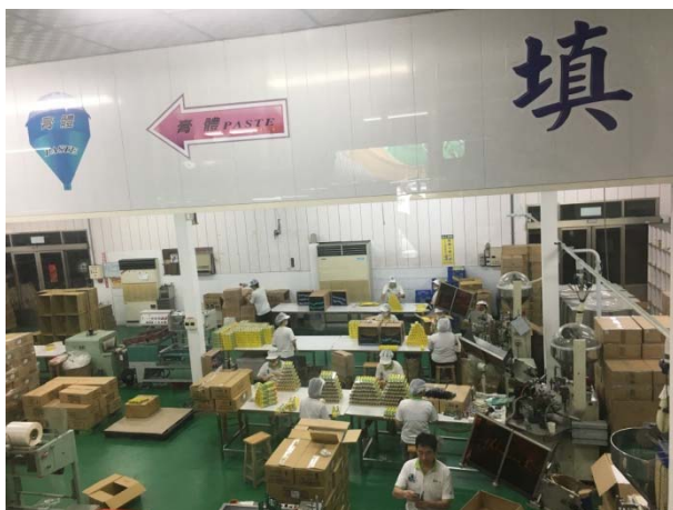
白人牙膏觀光工廠作業程序