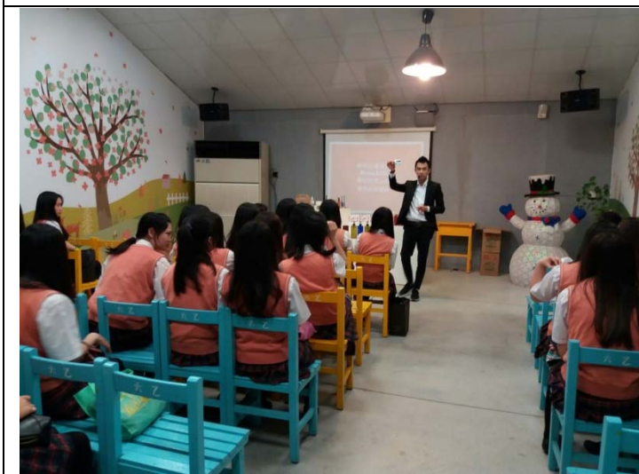
玫瑰精油萃取簡介