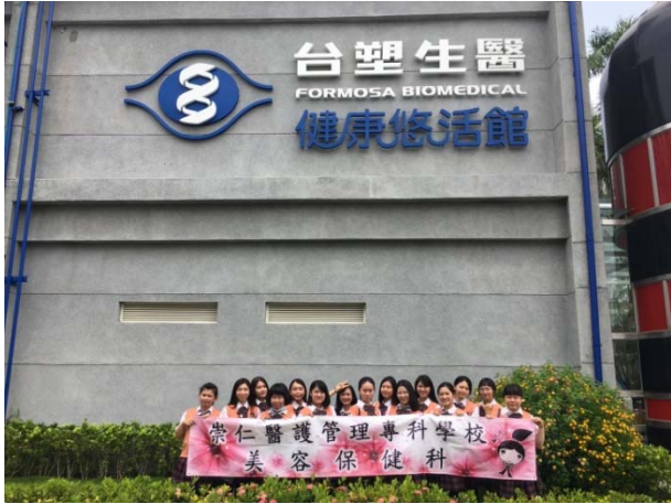
台塑生醫健康悠活館