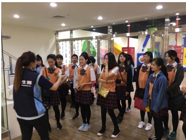
台塑生醫成立歷史簡介