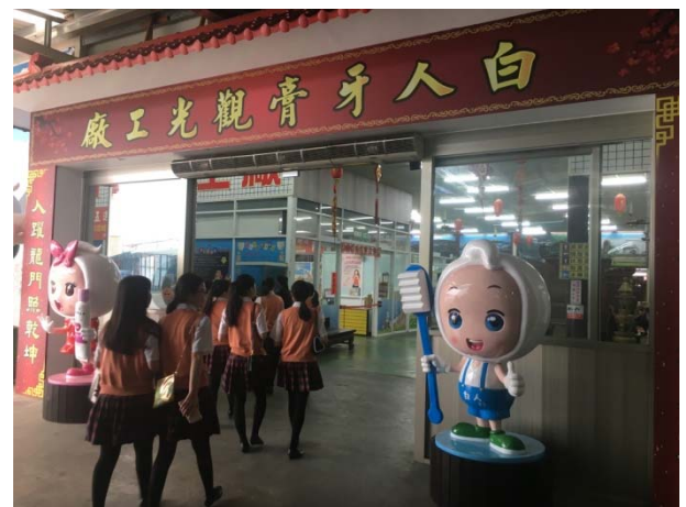
白人牙膏觀光工廠