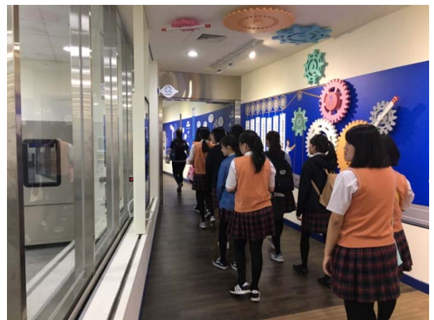
化粧品調製室及品管微生物實驗室