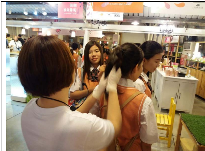
蘿莎玫瑰莊園是耐斯集團(NICE GROUP)旗下的香氛品牌