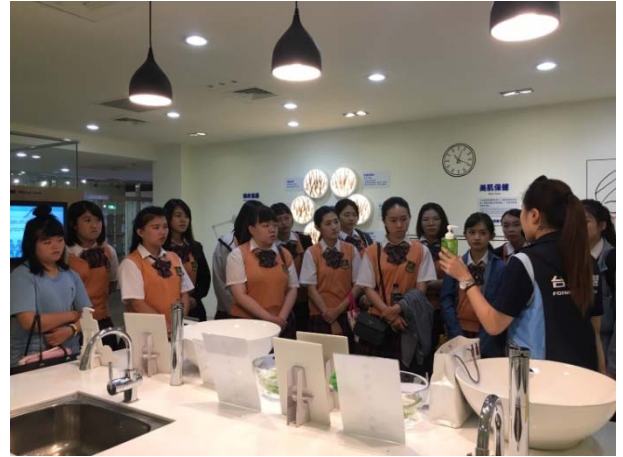
有機蔬果清潔液介紹